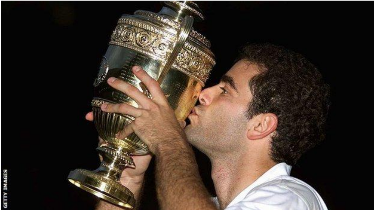
Sampras y el último beso al trofeo de Wimbledon, año 2000

Pete Sampras , ex número 1 y ganador de 14 Grand Slams, consiguió 7 títulos de Wimbledon entre 1993 y el 2000 . Primero fue campeón tres veces consecutivas (1993-1995) y luego 4 (1997-2000).