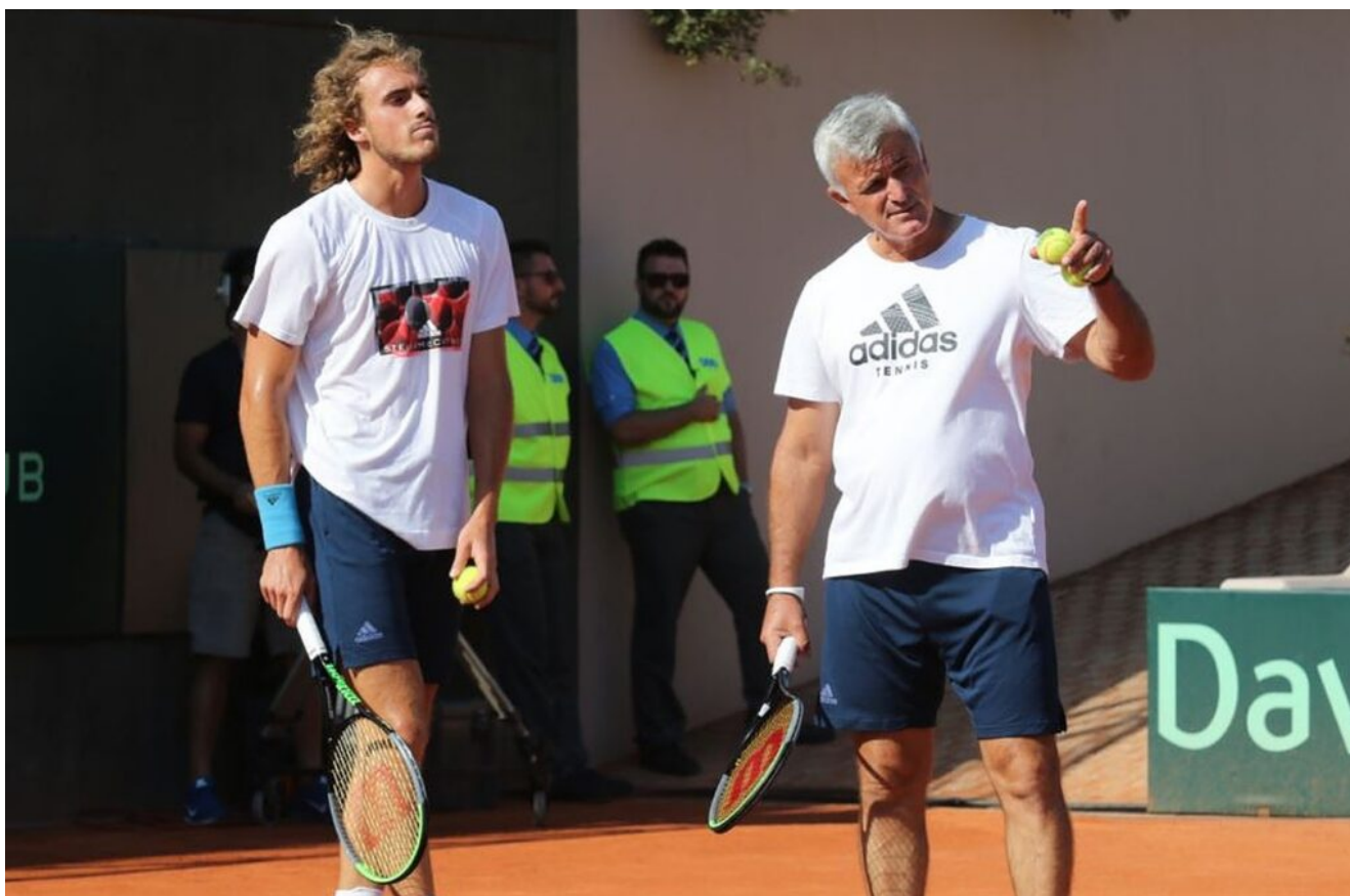
El griego y su padre/entrenador, Apostolos Tsitstipas durante

“El coaching en cada punto debería permitirse en el tenis. El deporte necesita adoptarlo. Somos probablemente uno de los únicos deportes globales que no usan coaching durante el juego. Háganlo legal. Ya es hora de que el deporte haga un gran paso hacia adelante”, manifestó Stefanos Tsitsipas (4º) en su cuenta de Twitter, reavivando el polémico debate.